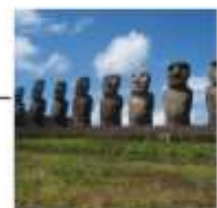
DAY 18 - 21 EASTER ISLAND