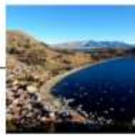
DAY 11 ONE DAY TRIP LAKE TITICACA COPACABANA ISOLA DEL SOL