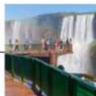
DAY 4 - 6 IGUAZU FALLS