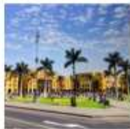
DAY 9 - 10 CUSCO - LIMA