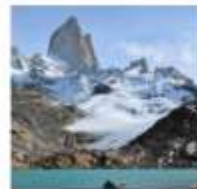
DAY 14 - 18 PATAGONIA