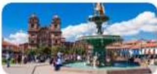
Plaza de Armas de Cusco

07.00 รับประทานอาหารเช้า 08.00 เที่ยวเมืองคusco