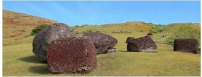
Puna Pau Quarry

แท่นหินโมอาย (Moai platform) ที่มีเอกลักษณ์ตรงที่โมอายสี่มือ ซึ่งพบได้เพียงแห่งเดียวบนเกาะ ตั้งอยู่ทางตะวันออกเฉียงของเมืองฮังกาโรอา (Hanga Roa) เชื่อกันว่าใช้เป็นจุดสังเกตทางดาราศาสตร์ เพราะหันหน้าไปทางดวงอาทิตย์ในช่วง Winter Solstice จึงเป็นที่ศาสนสถานและหอดูดาวของชาวราปานูอิ