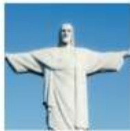
DAY 2 - 4 RIO DE JANAIRO