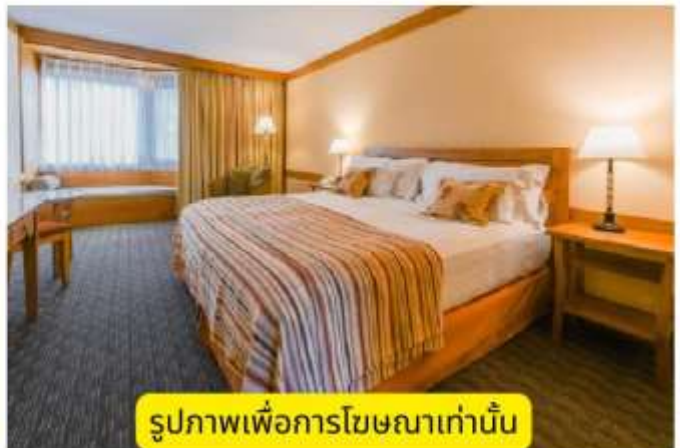
รูปภาพเพื่อการโฆษณาเท่านั้น

In the best location of de El Calafate โรงแรมอยู่เพียงไม่กี่กิโลจากย่านการค้าคาลาฟาเต้ ตั้ง อยู่ตรงหน้าอ่าวเรดอนดาและทะเลสาบอาร์เจนตินาที่มา พร้อมทั้งความสะดวกสบายและความอบอุ่น สักลับไม่ เหมือนใครในโลก ใครที่ได้มาเยือนปาตาโกเนียจะต้อง หลงไหลในความกว้างใหญ่และเสน่ห์ของธรรมชาติที่นี่ ที่เป็นเมืองท่องเที่ยวเล็ก ๆ แต่สวยงาม เมืองนี้ได้รับ การขนานนามว่าเป็น “เมืองหลวงธารน้ำแข็งของชาติ” เนื่องจากอยู่ใกล้ อุทยานแห่งชาติลอสกลาเซียเรสอัน ยิ่งใหญ่และธารน้ำแข็งเปริโตโมเรโน (Perito Moreno Glacier) ที่มีชื่อเสียง ซึ่งได้รับการประกาศให้เป็น มรดกโลกทางธรรมชาติโดย UNESCO ในปี 1981