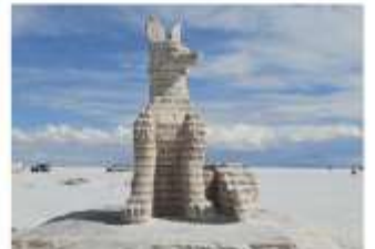
Escalera al Cielo