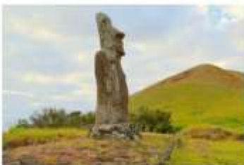
Ahu Uri Urenga

บ่าย รับประทานอาหารกลางวัน สำรวจเกาะอีสเตอร์ 19.30 รับประทานอาหารค่ำ TRADITIONAL DANCING SHOW WITH "UMU"