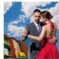
DAY 21 - 23 SANTIAGO - BUENOS AIRES