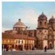
DAY 6 - 7 LIMA - CUSCO