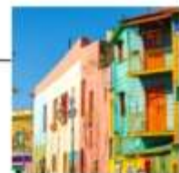
DAY 23 - 25 IN FLIGHT TO BANGKOK