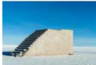
Escalera al Cielo

ทะเลเกลือ ซาลาร์ เดอ อูยูนี (Salar de Uyuni) เกิดจากบนที่ราบสูงอัลติปลานอ (Altiplano) เทือกเขาแอนดีส ไม่มีทางระบายน้ำออก ทำให้น้ำจากภูเขาที่อยู่ล้อมรอบไหลมารวมกันจนเกิดเป็นทะเลสาบขนาดใหญ่ที่มีความเค็มสูง อย่างไรก็ตาม ทะเลสาบขนาดใหญ่ตั้งแต่ยุคก่อนประวัติศาสตร์นี้ได้ถูกแสงอาทิตย์ที่รุนแรงทำให้ระเหยไป ทิ้งไว้เพียงผลึกเกลือที่ค่อยๆ ก่อตัวหนาขึ้น จนกลายมาเป็นทะเลเกลือในปัจจุบัน อีสระให้ท่านได้สัมผัสประสบการณ์ครั้งหนึ่งในชีวิตที่ได้มาเยือนทะเลเกลือหรือทะเลสาบน้ำเค็มที่ใหญ่ที่สุดในโลกพร้อมเก็บภาพผืนน้ำสะท้อนอันสวยงามที่เป็นเอกลักษณ์ของทะเลเกลือแห่งนี้