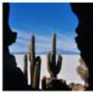
DAY 12 - 14 SALAR DE UYUNI