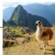
DAY 7 - 9 SACRED VALLEY MACHU PICCHU