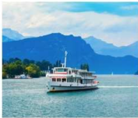
ทะเลสาบลูเซิร์น