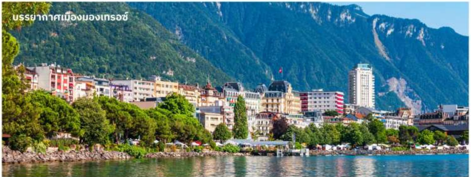
บรรยากาศเมืองมอเทอซ์

นำท่านถ่ายรูปด้านหน้า ปราสาทชิลยอง (Chillon castle) ปราสาทโบราณอายุกว่า 800 ปี สร้างขึ้น บนเกาะหินริมทะเลสาบเจนีวา ตั้งแต่ยุคโรมันเรื่องอำนาจโดยราชวงศ์ SAVOY โดยมีจุดมุ่งหมายเพื่อ ควบคุมการเดินทางของนักเดินทางและขบวนสินค้าที่จะสัญจรผ่านไปมาจากเหนือสู่ใต้หรือจากตะวัน ตกสู่ตะวันออกของสวิตเซอร์แลนด์ เนื่องจากเป็นเส้นทางเดียวที่ไม่ต้องเดินทางข้ามเทือกเขาสูงชัน ปราสาทแห่งนี้จึงเปรียบเสมือนด่านเก็บภาษีซึ่งเอาเปรียบชาวสวิสมานานนับร้อยปี