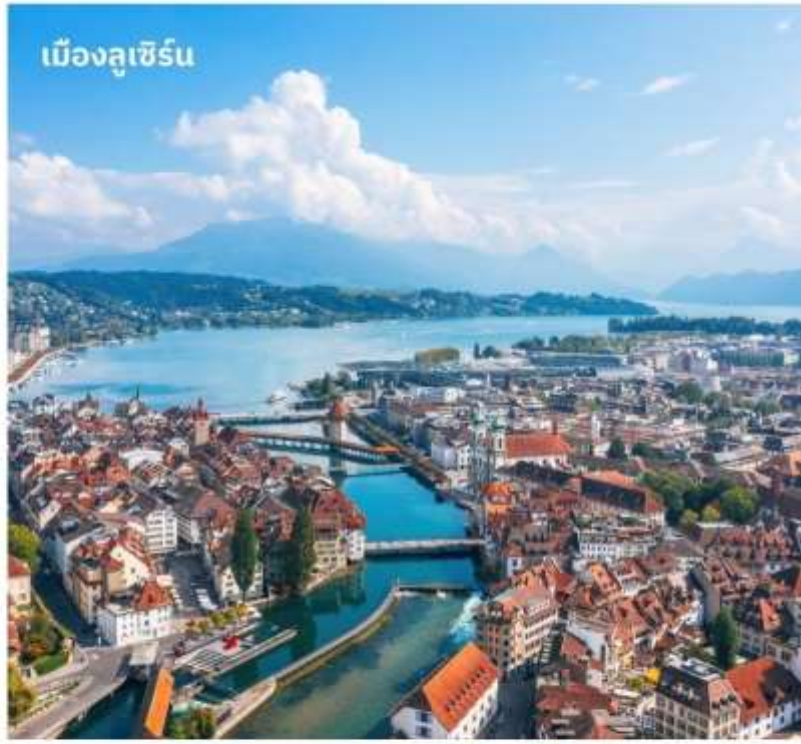
เมืองลูเซิร์น

บนยอดเขา จากนั้นนำท่านลงจากยอดเขา จุงเฟรา และ นำท่านเดินทางสู่ เมืองลูเซิร์น ใช้เวลาเดินทางประมาณ 1 ชั่วโมง อดีตหัว เมืองโบราณของสวิสเซอร์แลนด์ เป็นดินแดนที่ ได้รับสมญานามว่า หลังคาแห่งทวีปยุโรป (The roof of Europe)