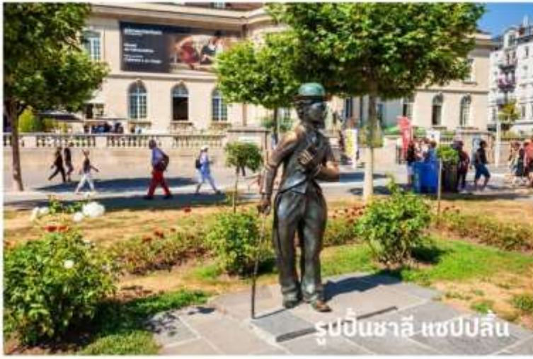
รูปปั้นชาลี แซปป์ลี