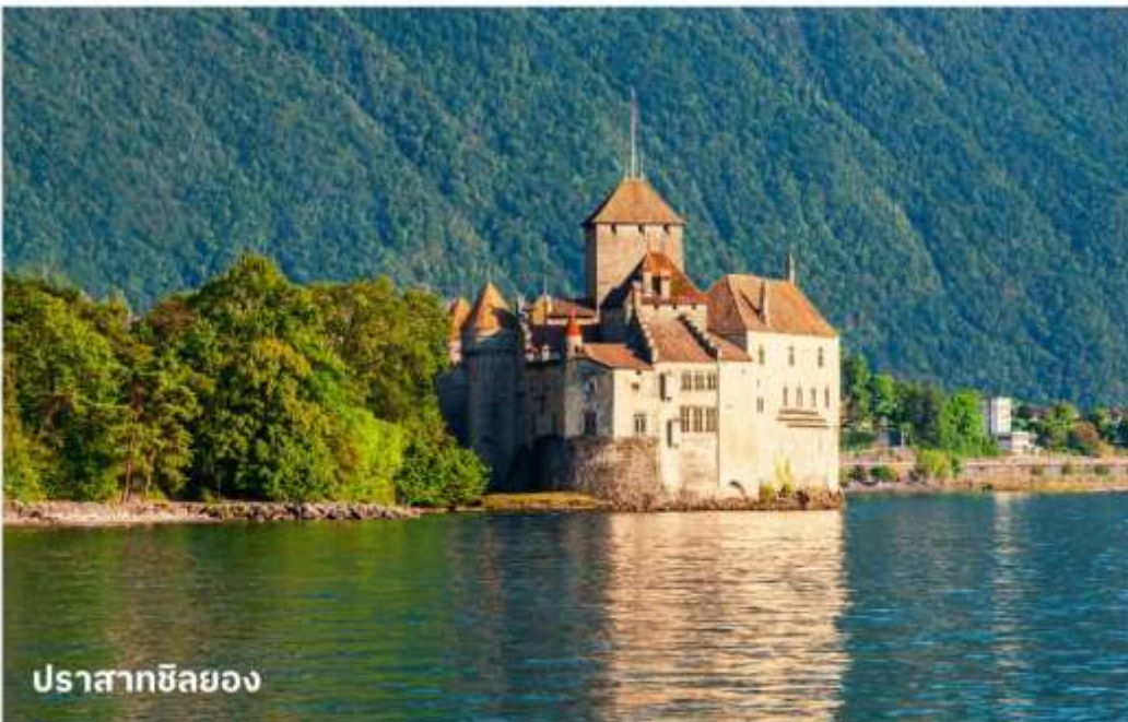
ปราสาทชิลยอง