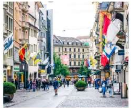
ถนนบาห์นโฮฟชตราสเซอร์