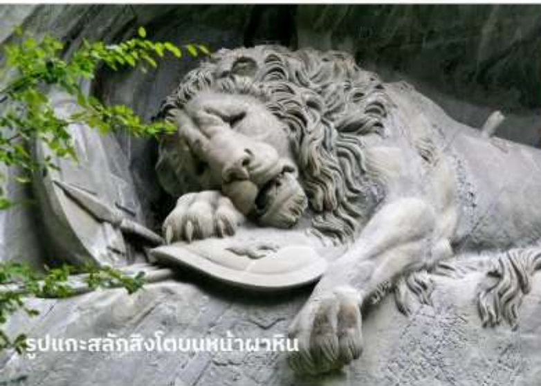
รูปแกะสลักสิงโตบนหน้าผาหิน