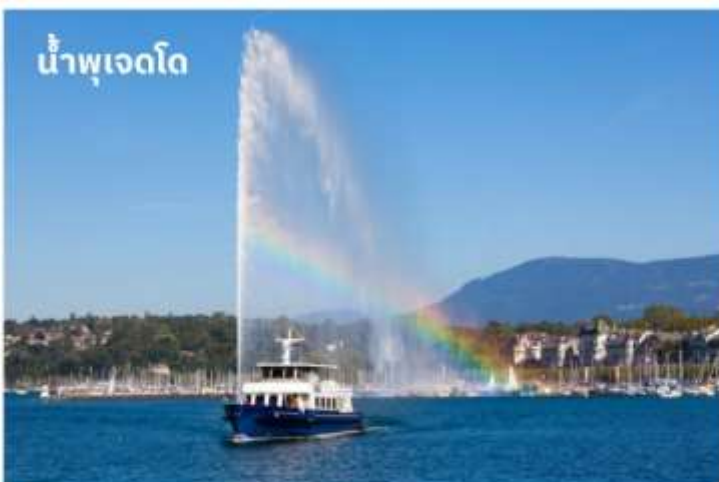
น้ำพุเจดโด

บริการอาหารค่ำ ณ ภัตตาคาร นำท่านเข้าสู่ที่พัก Novotel Bussigny หรือเทียบเท่า