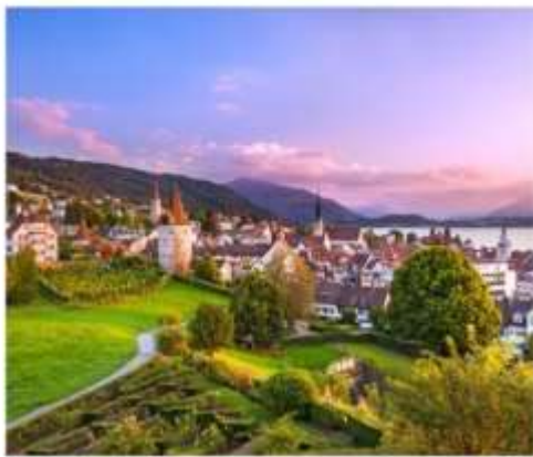
เมืองซูก

ทะเลสาบที่ขึ้นชื่อเรื่องความงามราวกับภาพวาด โอบล้อมไปด้วยขุนเขาและหมู่บ้านริมฝั่งที่มีเสน่ห์ ระหว่างทางผ่านชมเมืองเก่าที่เต็มไปด้วยเสน่ห์ของสวิตเซอร์แลนด์ ก่อนจะล่องเรือกลับสู่ลูเซิร์นอีกครั้ง จากนั้นนำท่านเดินทางสู่ เมืองซูก (Zug) ใช้เวลาเดินทางประมาณ 1 ชั่วโมง