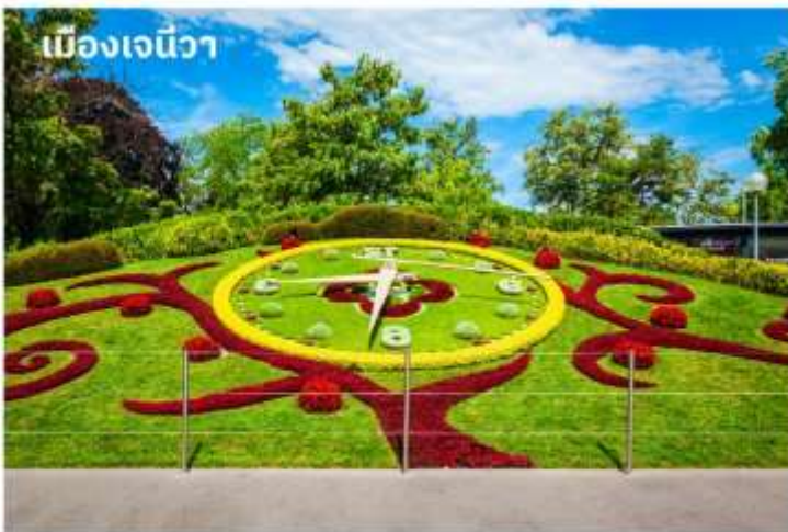
เมืองเจนีวา

จากนั้นนำท่านเดินทางไปยัง เมืองโลซานน์ ใช้เวลาเดินทางประมาณ 1 ชั่วโมง เป็นอีกเมืองที่ตั้งอยู่บนของทะเลสาบเจนีวา เมืองโลซานน์นับได้ว่าเป็นเมืองที่มีเสน่ห์โดยธรรมชาติมากที่สุดเมืองหนึ่งของสวิตเซอร์แลนด์มีประวัติศาสตร์อันยาวนานมาตั้งแต่ศตวรรษที่ 4 ในสมัยที่ชาวโรมันมาตั้งหลักแหล่งอยู่บริเวณริมฝั่งทะเลสาบที่นี่ เนื่องจากเมืองโลซานน์ตั้งอยู่บนเนินเขาริมฝั่งทะเลสาบเลคเลม็งค์ จึงมีความสวยงามโดยธรรมชาติ ทิวทัศน์ที่สวยงามและอากาศที่ปราศจากมลพิษ จึงดึงดูดนักท่องเที่ยวจากทั่วโลกให้มาพักผ่อนตากอากาศที่นี่ เมืองนี้ยังเป็นเมืองที่มีความสำคัญสำหรับชาวไทยเนื่องจากเป็นเมืองที่เคยเป็นที่ประทับของสมเด็จพระเจ้า