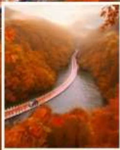
จุดดำขำ ซือจื่อกวาน

รับฟรี!! ประกันสุขภาพ และ อุบัติเหตุ 2 ล้านบาท