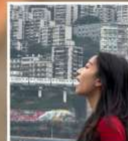
กินรถไฟฟ้ากะลุติ๊ก