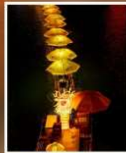
ล่องเรือมังกร แม่น้ำก้งสู่ย