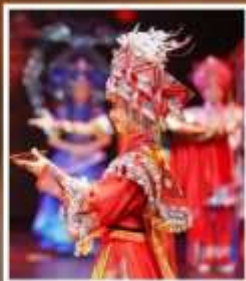
โซวระบำกู่เจีย