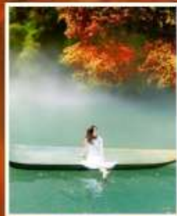
ผิงชาน แกรนด์แคนยอน