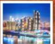
ดัก RAFFLES CITY