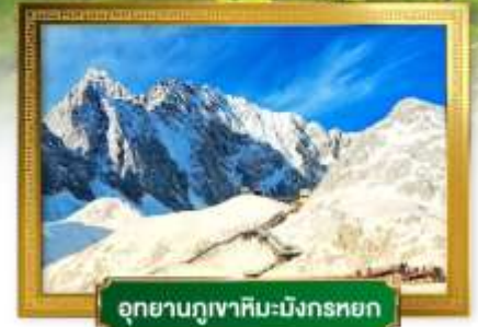
อุทยานกุเวาหิมะมังกรหยก

เดินทางโดยสายการบินโซน่าอีสเทิร์นแอร์ไลน์