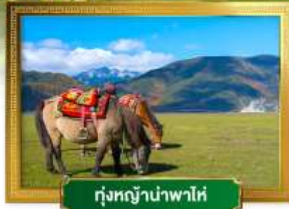
ทุ่งหญ้าป่าพาโห่