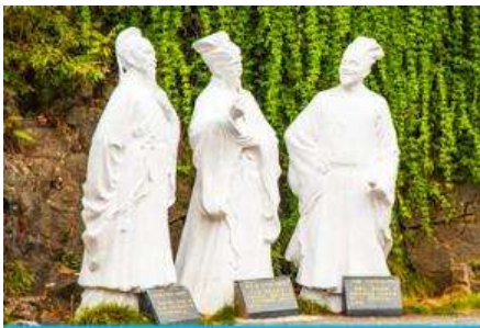
อุทยานถ้ำสามสหาย