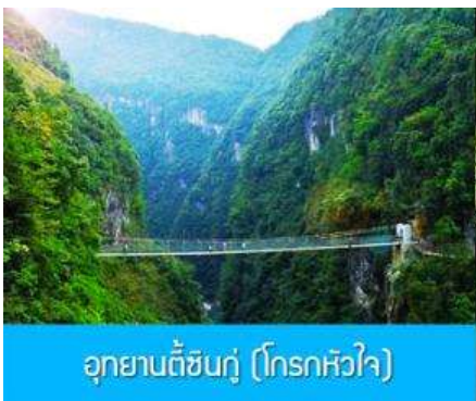
อุทยานตีสันกู่ (โกรทหัวใจ)

พักที่ โรงแรม ENSHI XIPU HOTEL ระดับ 4 ดาวท้องถิ่นหรือเทียบเท่าในเมืองเียนซือ