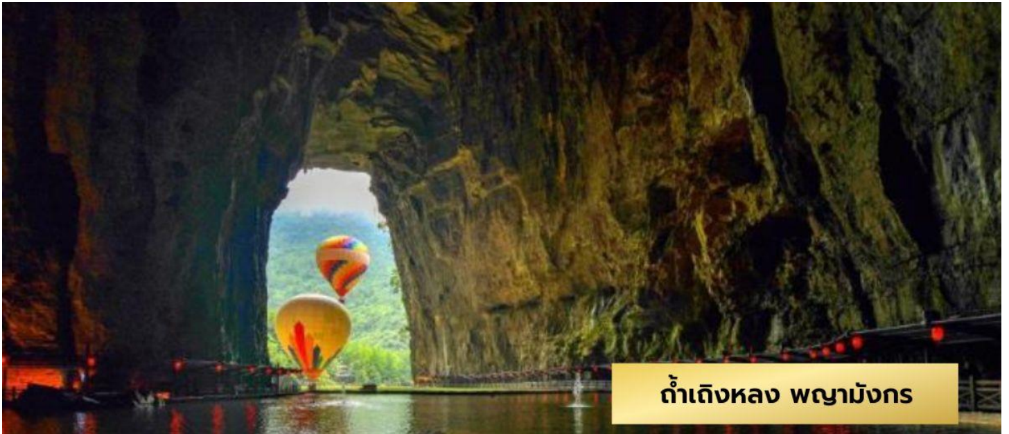
ถ้ำแดงหลวง พญามังกร