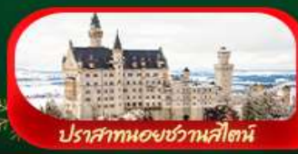
ปราสาทน้อยฮัลล์บูร์ก

ตะลุยเส้นทางยุโรปตะวันออกท่ามกลางแสงไฟคริสต์มาส ชมปราสาทน้อยหวานสไตล์เมืองเก่าฮัลล์บูร์ก และหมู่บ้านอีสต์สติกต์ เดินเล่นปรากเมืองแห่งปราสาท สะพานชาร์ลส์ หอนาฬิกาดาราศาสตร์ และปราสาทซสท์ครุมลอฟสุดโรแมนติก ส่องแม่น้ำดานูบ เทียวพระราชวังเซ็นบรุนน์ และสัมผัสกลิ่นอายคริสต์มาสเกิดสุดอบอุ่นทั่วเมือง