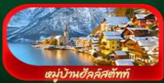
หมู่บ้านอีสต์สติกต์