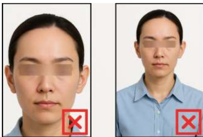
รูปที่ไม่ได้ขนาด ตามที่สถานทูตกำหนด