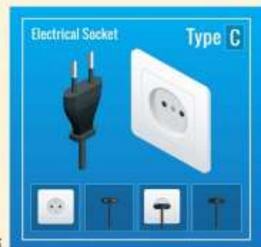
ปลั๊กไฟที่ใช้ที่อียิปต์