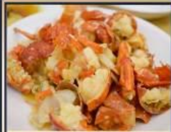
กุ้งมังกรอบซีส