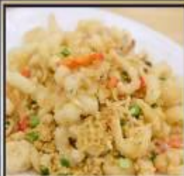
หมึกทอดกระเทียม