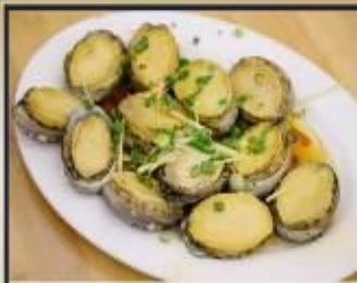
เปาฮื้อสดนึ่ง