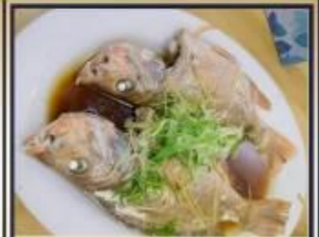
ปลาหนึ่งซีอิ๊ว