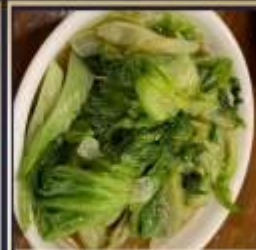
ผัดผักตามฤดูกาล