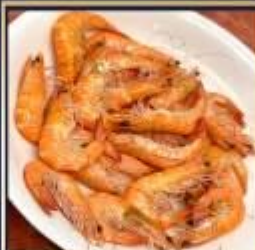
กุ้งหวานลวก