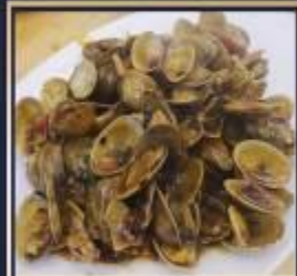
ผัดหอยลาย