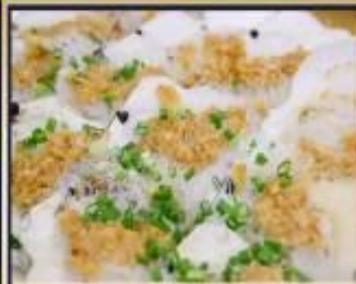
หอยเชลล์อบวุ้นเส้น