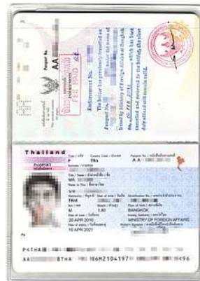
Passport เต็ม 2 หน้า