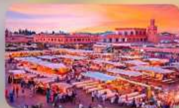
นครสีชมพูมาราเกช