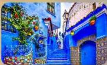
นครสีฟ้าเซฟซาอูน