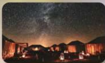
นอนดูดาวทะเลทรายซาฮารา