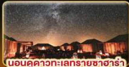
นอนดูดาวทะเลทรายซาฮารา