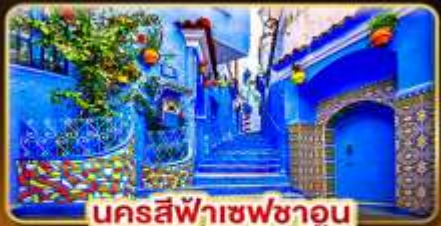
นครสีฟ้าซฟาฮอน

ท่องเที่ยวดินแดนฟ้าจรดทราย เก็บทุกไฮไลท์ใน โมร็อกโก อารยธรรมสุดขบถทวีป