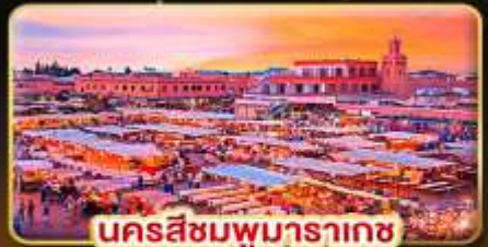
นครสีชมพูมารากช